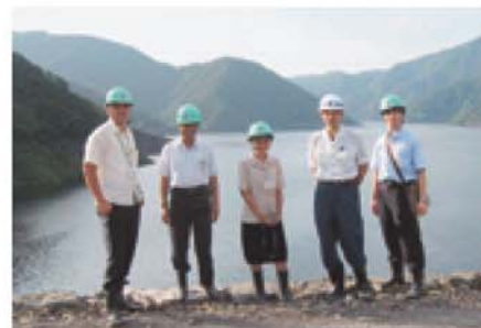
友好合作实地考察

促进成员间的友好合作,通过人员互访和会议交流,加强对各方经验的吸收以及优秀案例的理解。